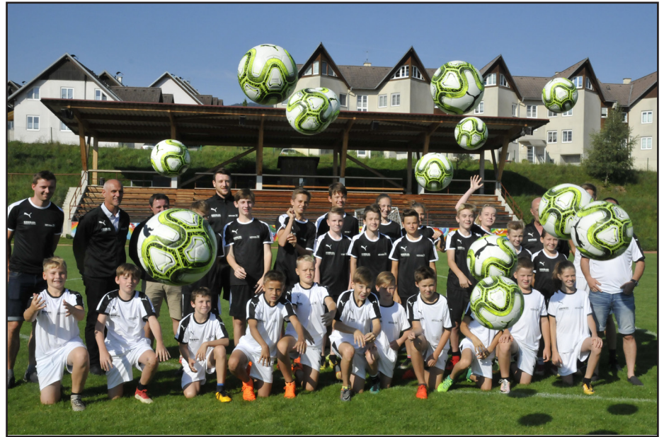
Die Kicker der Fußballakademie Birkfeld - Strallegg