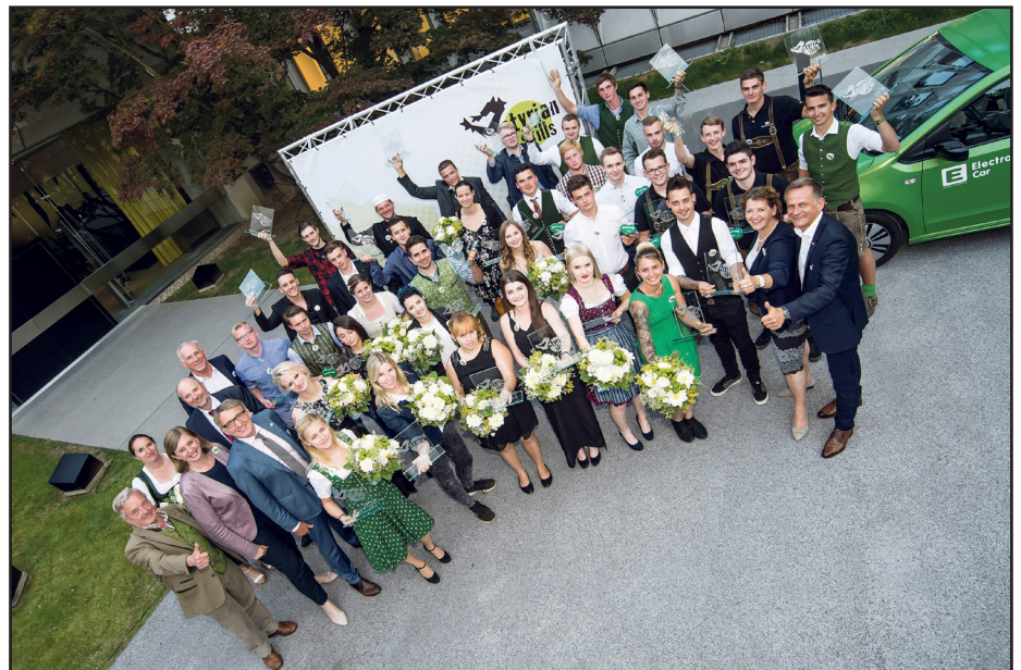
Die strahlenden Sieger bei den „StyrianSkills“

Die duale Ausbildung sei ein wichtiges Fundament, das auch große Veränderungen wie Digitalisierung, Automatisierung und demografischem Wandel standhält, betonte Eibinger-Miedl: