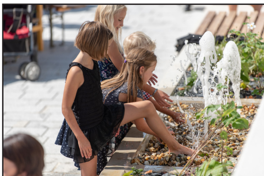
Unser neuer Dorfbrunnen belebt den Dorfplatz und bot den Kindern beim Fest eine willkommene Abkühlung.