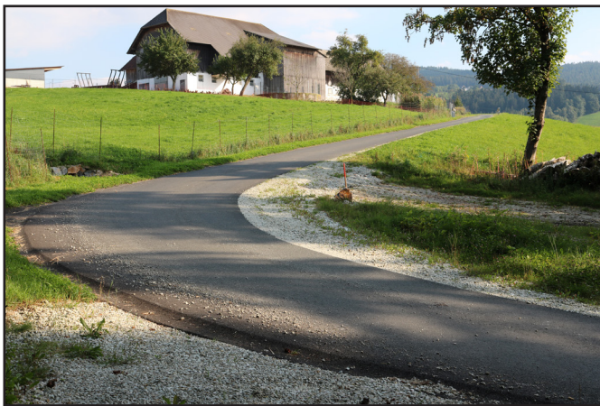
Der Moihoferweg I in Außereggen

Zurzeit wird an den Gemeindestraßen gearbeitet, die Unwetter sind hoffentlich vorbei und so werden noch im Herbst die Banke aufgefüllt und Spritzdecken und Fugen saniert.