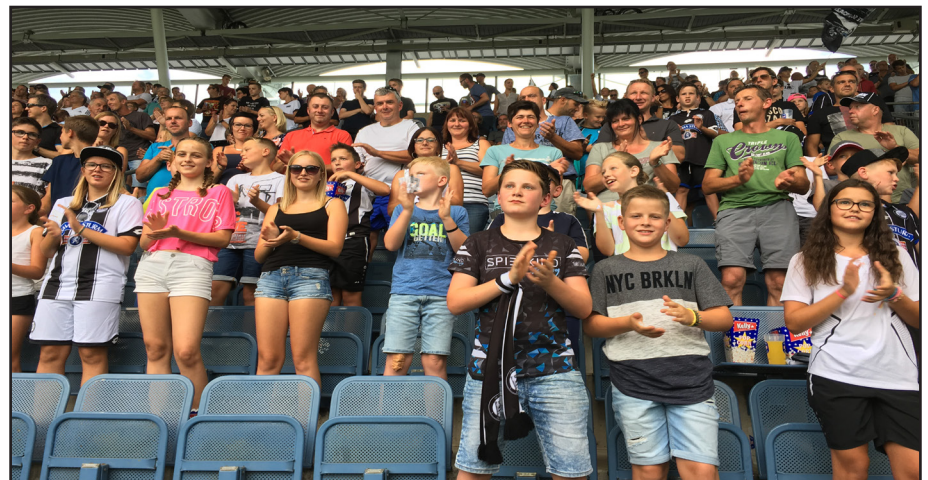
Der heurige Kindersommer führte auch zum Heimspiel des SK Sturm gegen Altach. Auch wenn es zu keinem Heimsieg reichte, war es für die Kinder ein Riesenerlebnis. Herzlichen Dank an den UFC Strallegg für die Organisation.