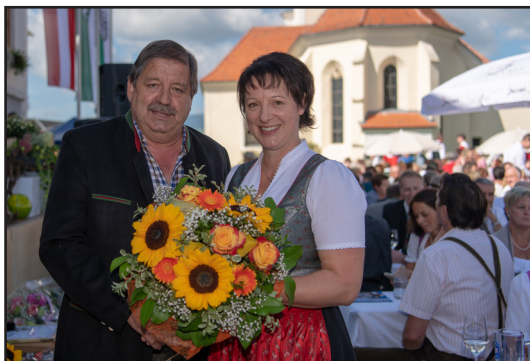
Eine sehr harmonische Amtsübergabe, ein neuer Lebensabschnitt für den scheidenden Bürgermeister und die neue Bürgermeisterin beginnt.