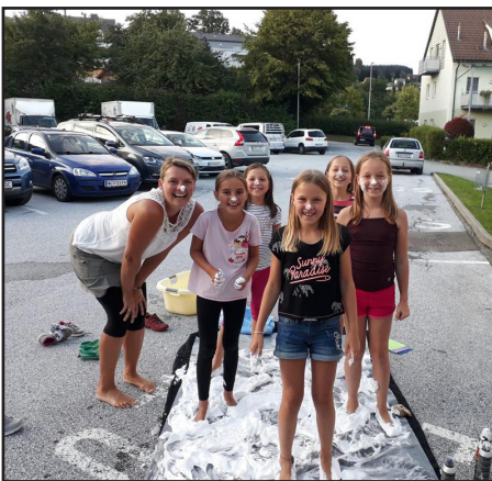
Bei der Übernachtung in der NMS, organisiert von der Theatergruppe, gab es Spiel und Spaß und gruselige Überraschungen.