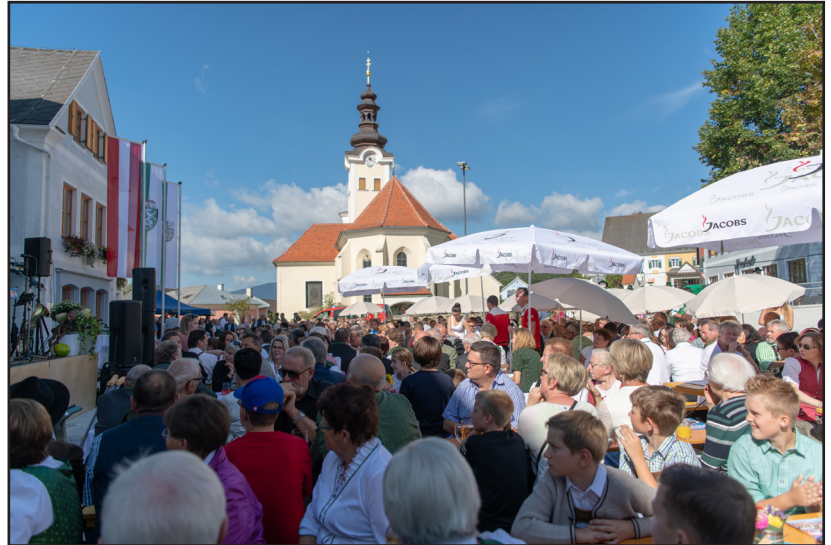
Der Besucheransturm war enorm. Hunderte Besucher bestaunten den neuen Dorfplatz.