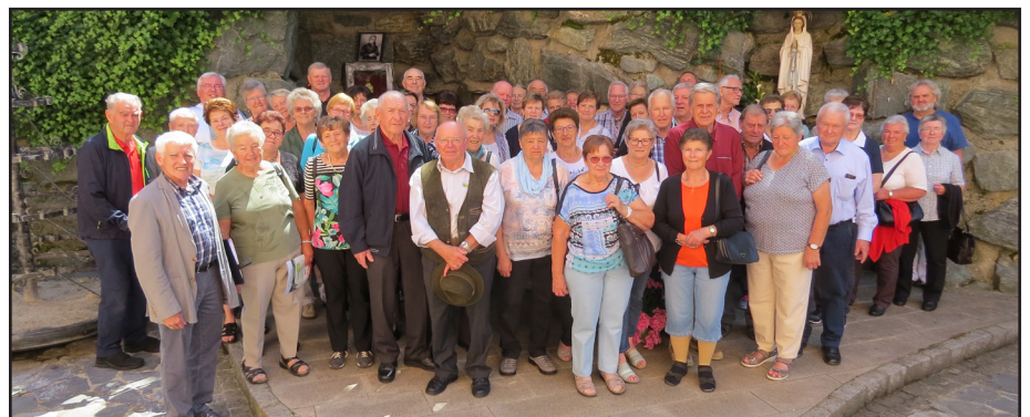
Wallfahrt nach Unterlamm

Anschließend genossen wir den guten Brennsterz, der vor unseren Augen im Rauchstubenhaus Schirner bei offenem Feuer zubereitet wurde. Besonders interessant war die Führung durch das rund 300 Jahre alte Haus. Bei guter Laune und herrlichem Wetter traten wir mit dem Traktorzug den Heimweg an.