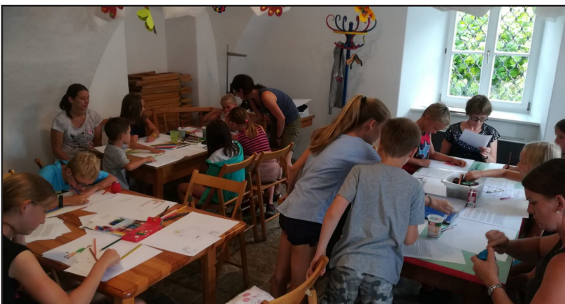
Ein Bücherl mit Geschichten und Sagen rund um Strallegg und aus der Region wird gerade vom Elternverein gestaltet. Im Rahmen des Kindersommers wurden an einem Nachmittag von den Kindern die Bilder dazu gemalt. Dieses Geschichtenbuch ist beim heurigen Adventmarkt des Elternvereins am 1. Dezember auch käuflich zu erwerben. Eine tolle Idee!