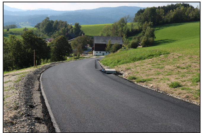
Der Moihoferweg II in Feistritz