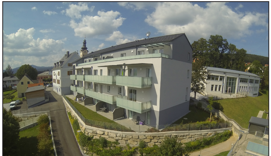
Die zwölf Wohnungen wurden im September übergeben

Die größeren Baustellen beim Bauhof und bei der Kläranlage sind erfolgreich abgeschlossen worden. Großzügige Sanierungen und Ausbesserungen an den Gemeindestraßen wurden im Herbst durchgeführt.