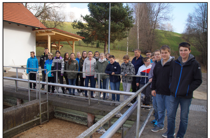
Besuch bei der Kläranlage Strallegg