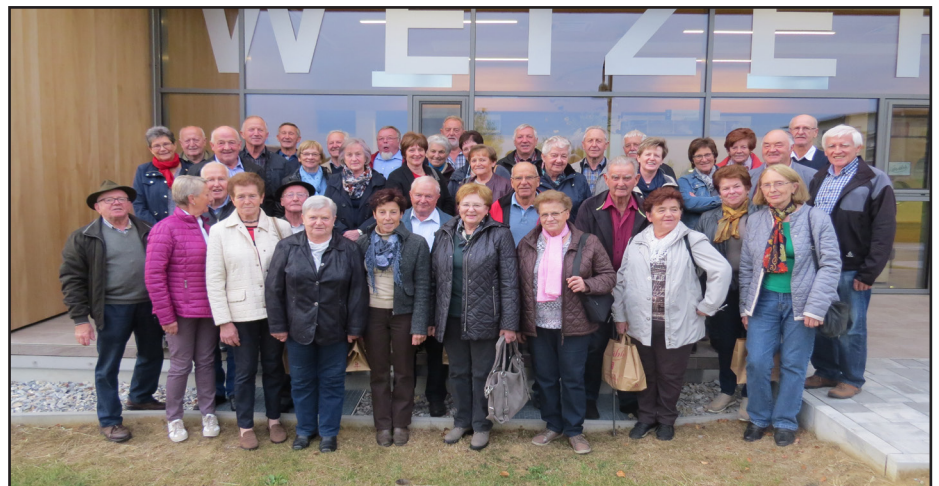
Ausflug zu den Weizer Schafbauern

Der Seniorenbund wünscht allen Stralleggerinnen und Stralleggern frohe Weihnachten und für das neue Jahr Gesundheit, Glück und Gottes Segen.