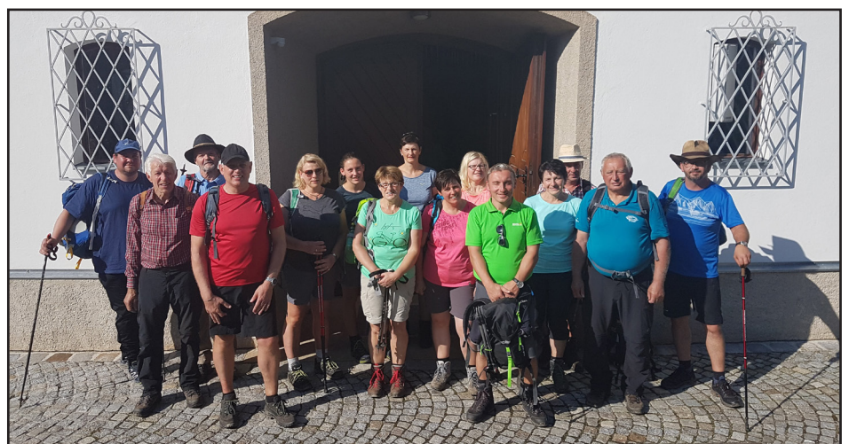
Fußwallfahrt nach Maria Fieberbründl