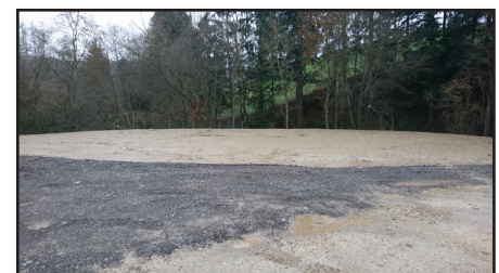
Der Schlammteich wurde aufgefüllt - ein großer Platz ist entstanden