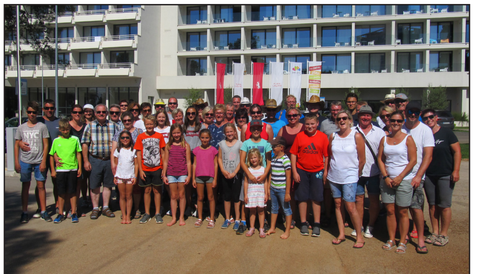
Der Vereinsausflug führte heuer nach Umag

gerinnen und Stralleggern ein frohes, besinnliches Weihnachtsfest und ein friedliches, gesundes neues Jahr 2019!