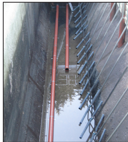
Eines der großen Klärbecken den Belüftungsrohren und den Rohren am Boden zum Absaugen des Klärschlammes.

sich der Klärschlamm am Boden ab, wird dort abgesaugt und wurde in der Vergangenheit im großen Schlammteich gelagert. Im Herbst erfolgte dann die Ausbringung auf den landwirtschaftlichen Flächen durch den Maschinenring.