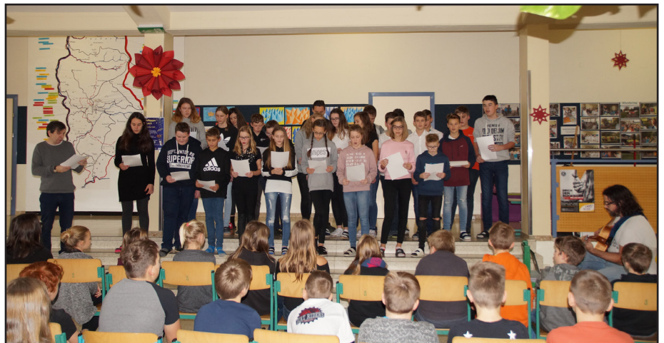
Präsentation der Ergebnisse der Intensivsprachwoche Ende November