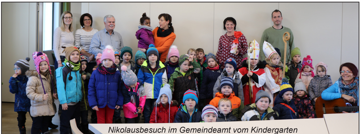
Nikolausbesuch im Gemeindeamt vom Kindergarten

Liebe Stralleggerinnen und Strallegger, ich wünsche Euch allen ein gesegnetes Weihnachtsfest, ruhige Tage im Kreise der Familie und ein gesundes und erfolgreiches Jahr 2019!