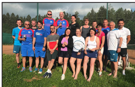
Trainingslager in Ligist

20 Mitglieder konnten bei perfekten Bedingungen an ihrer Technik und Kondition feilen. Bei der Sommermeisterschaft waren insgesamt sechs Mannschaften am Start – so viele wie noch nie. Die drei Herrenmannschaften konnten sich in den jeweiligen Klassen im guten Mittelfeld etablieren. Noch besser erging es unseren beiden Damenmannschaften. Mit neuen Dressen und einer großen Portion an Spaß und Ehrgeiz konnten tolle Erfolge erzielt werden.