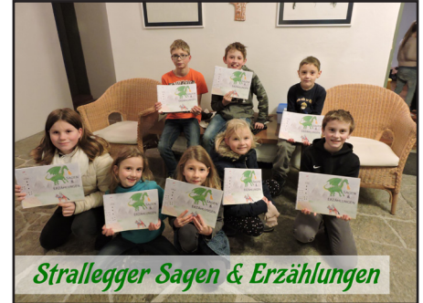
Strallegger Sagen & Erzählungen

zeit und ein glückliches und gesundes neues Jahr!