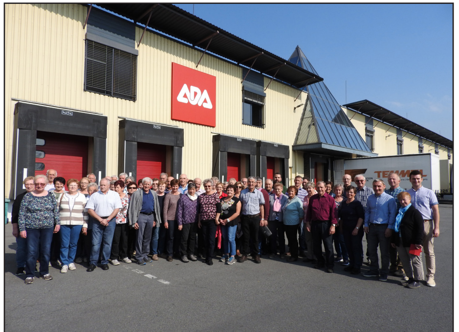
Besichtigung der Fa. ADA in Ungarn