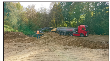
Der Schlammteich wird nicht mehr benötigt, der restliche Klärschlamm wurde durch die Fa. Herbst fachgerecht entsorgt.

Dieser wird ca. 6 mal im Jahr entsorgt. Für diesen Container wurde ein Zubau und eine neue Zufahrt errichtet. Unser Klärwärter Stefan Mosbacher wurde bestens eingeschult und ist mit der neuen Anlage sehr zufrieden. Die Investitionskosten für die Umbauarbeiten und die technische Umrüstung beliefen sich auf € 180.000,--. Nun sind wir auch bei der Kläranlage wieder auf dem neuesten Stand der Technik.