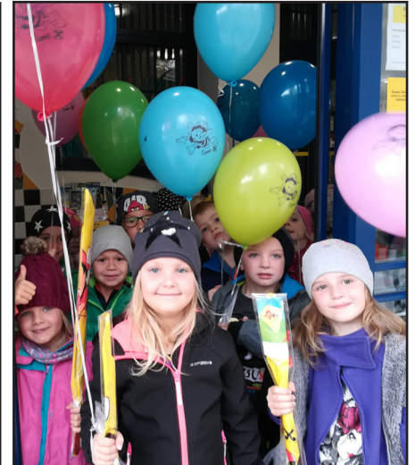
Die stolzen Kinder nach dem Einsparen